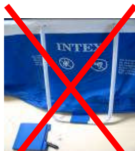
Montage incorrect sans languette de connexion

Quelle est la fonction de ces languettes ?