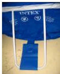
Montage correct avec languette de connexion

- Passer le pied en U dans la languette et clipper les pieds en U dans les poutres. Le montage obtenu est le suivant :